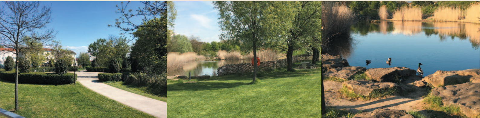
Le parc départemental Jean Moulin - les Guilands