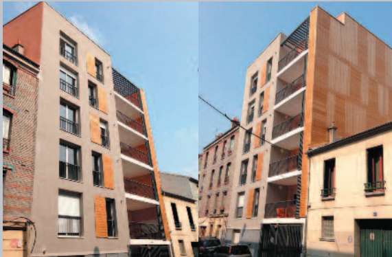
Réalisation de la Villa Kléber 22 rue Kléber 93100 Montreuil