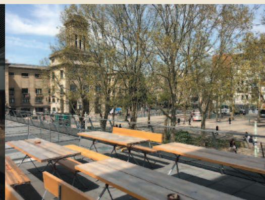
Centre commercial Grand Angle