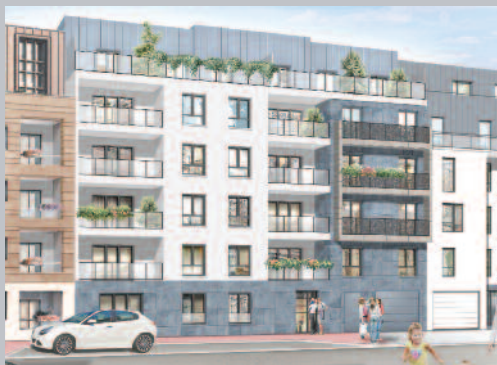
Réalisation de la Villa Les Chênes 98 rue Alexis Pesnon 93100 Montreuil