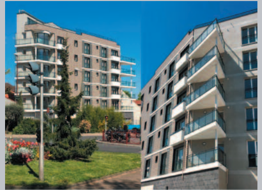
Réalisation de la Villa Faidherbe 70 avenue Faidherbe