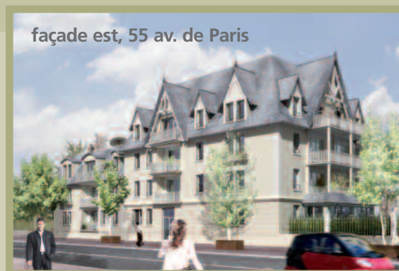
façade est, 55 av. de Paris