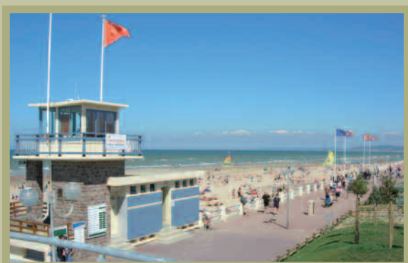
poste de secours

C'est tout l'esprit de la résidence L'Avocette qui, à un jet de coquillage de la plage, offre aux regards une architecture élégante et à ses futurs habitants calme, confort, sérénité.