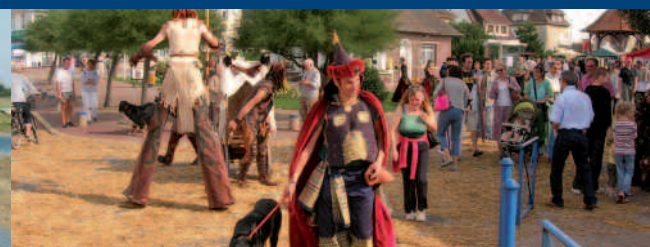
cidre et dragons